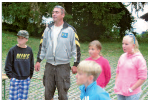
Concentration lors des activités et jeux

Le traditionnel tournoi open de pétanque est sur les rails et c'est pour ce samedi prochain que les équipes de deux joueurs pourront se confronter en toute amitié sur le boulo-drome aménagé au Stand de tir de Nods. Les inscriptions seront enregistrées le 15 août dès 9 h. et les jeux seront lancés à 9 h 30. Cette rencontre est ouverte à chacune et chacun et tout est mis à la disposition des joueurs et des spectateurs pour vivre des mo-