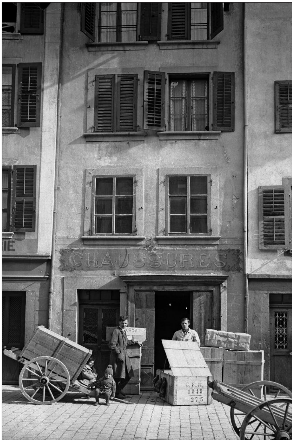
La Neuveville 1927 - Rue du Marché, magasin de chaussures J. Kurth.