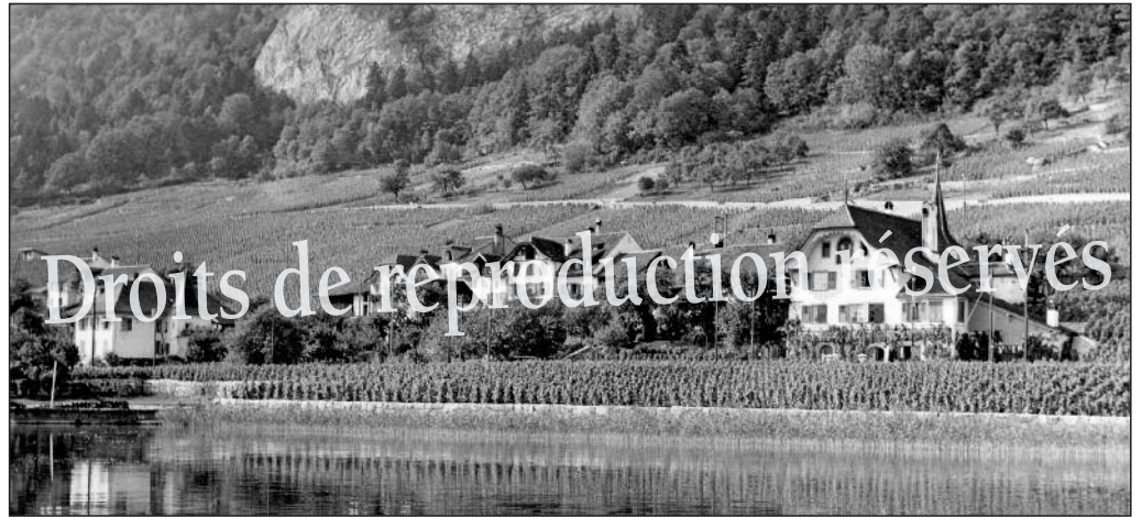
Chavannes vers 1940.

A noter qu'à la période française (1797-1815), Chavanne ne prend jamais le s final.