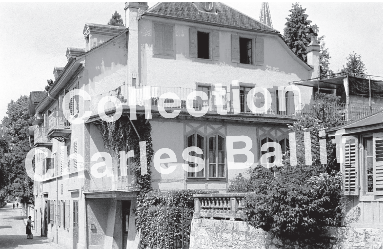
La Neuveville 1950, route de Biemme, pension Tissot.