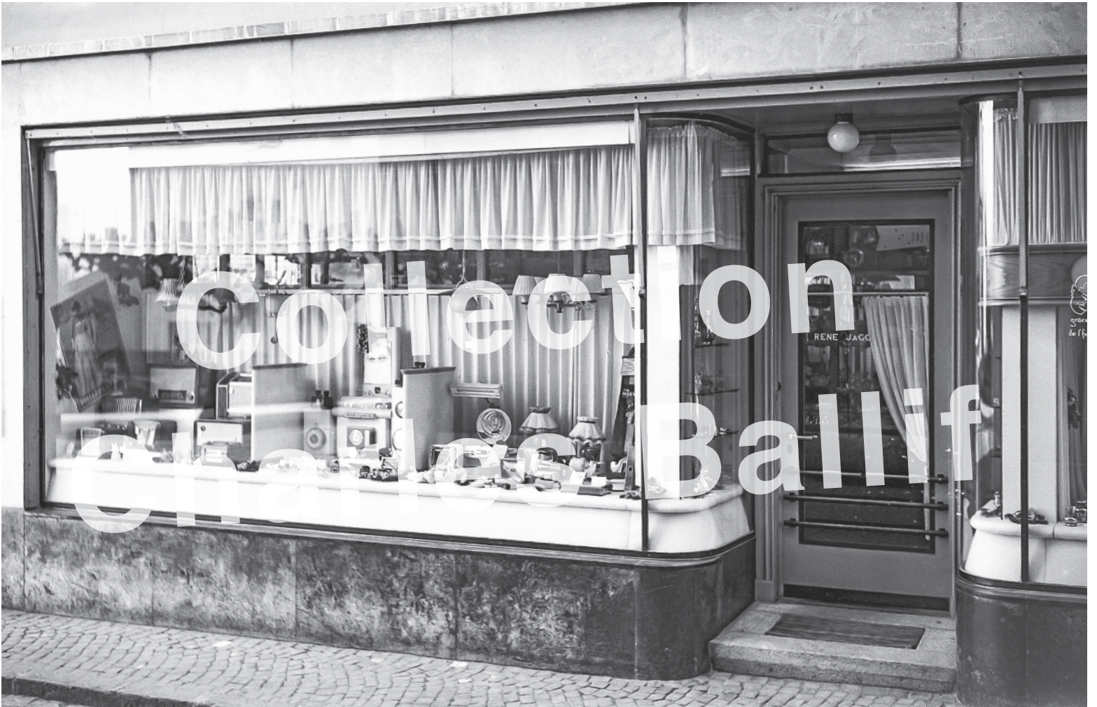
La Neuveville 1948, Grand Rue, vitrine Horloger Jaggi.