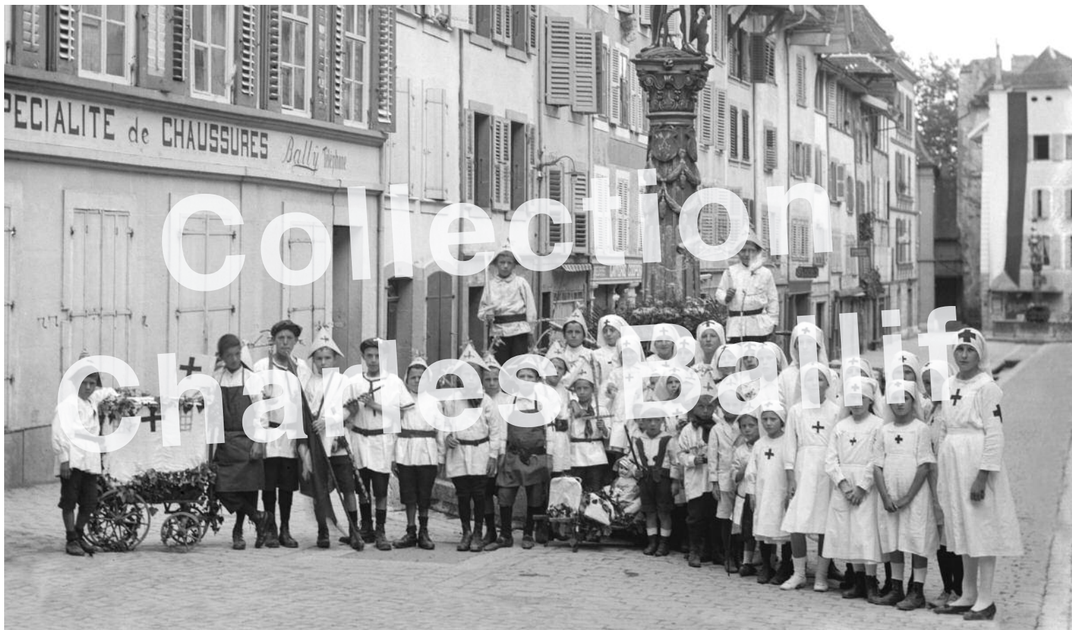
La Neuveville 1919, commémoration de l'armistice de 1918.