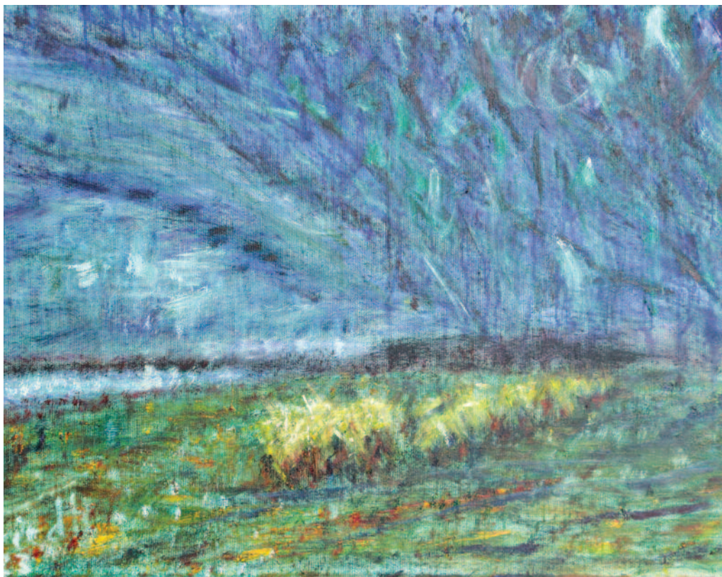
Loin d'être toujours figuratifs, les paysages de Serge Friedli conviennent à l'évasion. (l'dd)

Passionné par les chromatismes et les paysages citadins, Serge Friedli sera à La Voirie à Bienne une semaine dès le 10 février prochain. Après une série d'expositions plutôt orientées vers Neuchâtel, Serge Friedli revient à Bienne, près de l'Ancienne Couronne où il avait déjà captivé un public averti. Cette fois, c'est à La Voirie, du 10 au 18 février, que l'artiste présentera ses œuvres, pratiquement toutes postérieures à celles présentées lors de sa dernière exposition entre 2020 et 2021, avec un vernissage le 9 février, invitant les amateurs d'art à plonger dans son univers coloré et urbain.