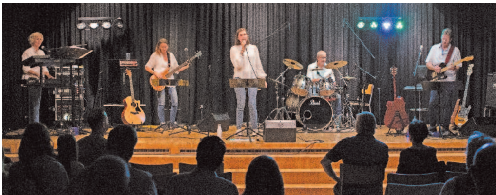
Le groupe Back\Slash lors de son concert à Christ Roi à Bienne

Lamboing – Tous les mardis soir, le groupe Back\Slash répète dans les locaux de la protection civile, et se produira samedi 5 novembre à Espace noir à Saint-Imier.