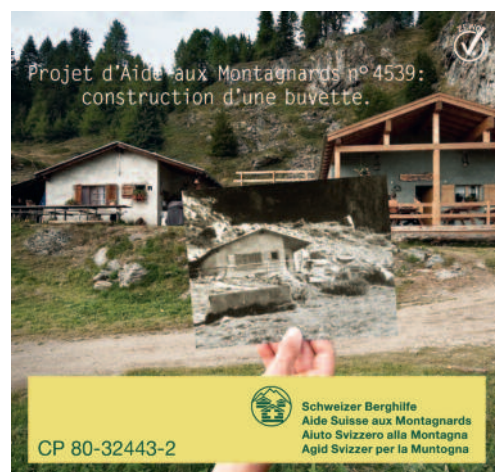
Projet d'Aide aux Montagnards n° 4539: construction d'une buvette.