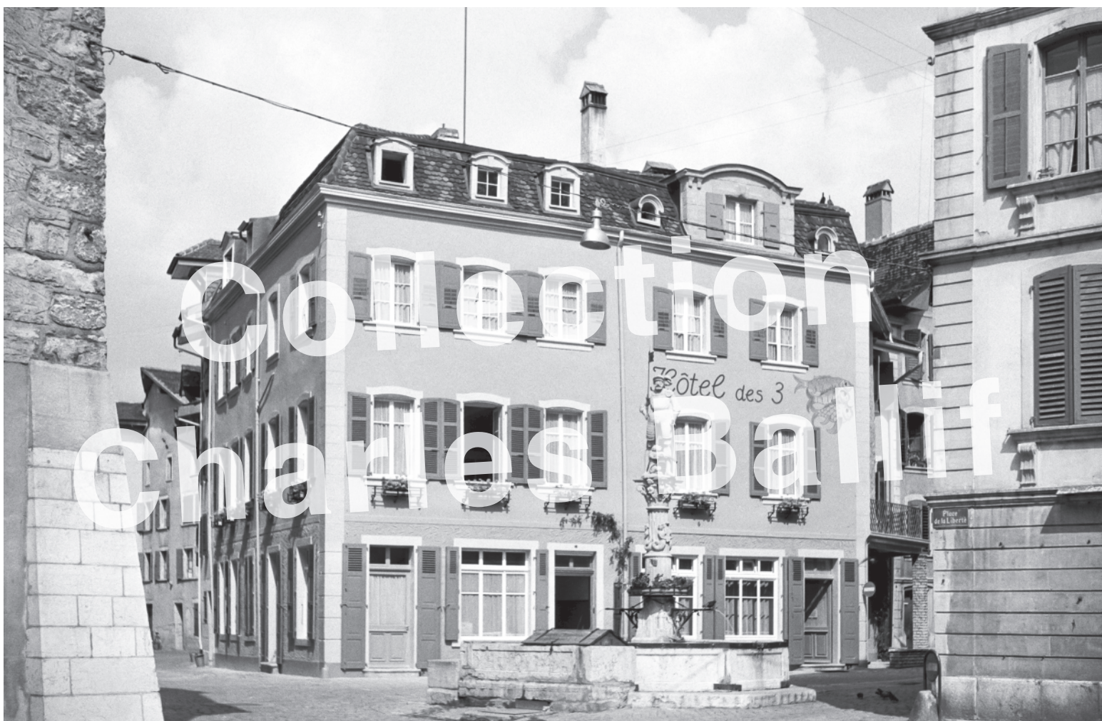
La Neuveville 1951, rue du Marché, l'Hôtel des 3 poissons.