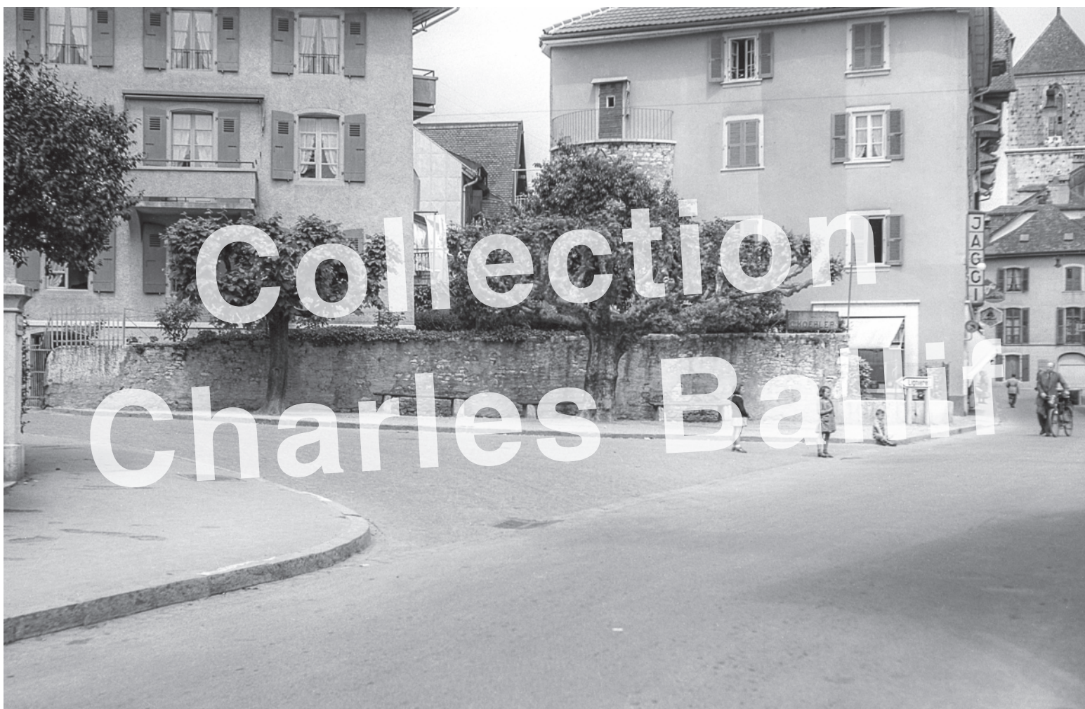
La Neuveville 1951, croisement rue du Tempé - Grand'Rue.