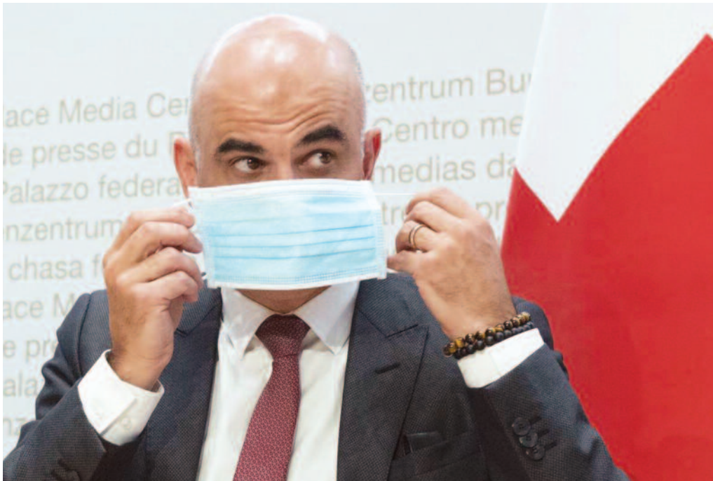
Alain Berset lors de la conférence de mercredi "Laissons enfin tomber les masques!"

Depuis la levée de l'obligation de porter le masque dans les espaces publics le 17 février dernier, tout le monde est tout sourire. Un sourire qui s'élargira encore cette semaine puisque les Neuvevillois auront la chance de rencontrer leur ministre de la santé, Alain Berset en personne. Rendez-vous est donné dès 18h sur la place de la Liberté pour célébrer comme il se doit la fin de toutes les mesures sanitaires en bonne et due forme