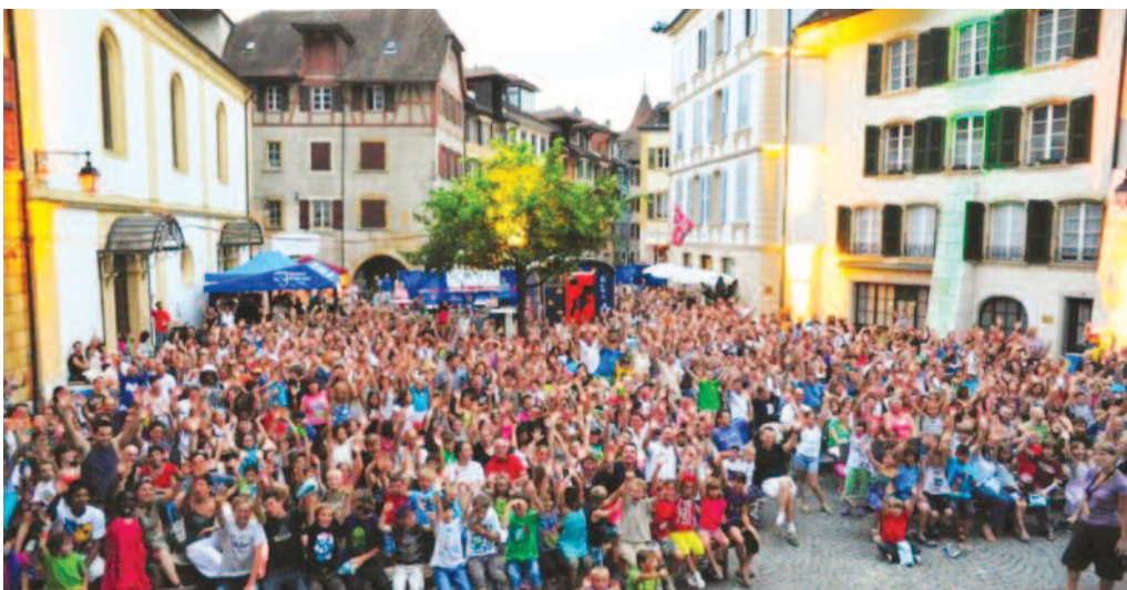
La place de la Liberté lieu des réjouissances festives prévues ce vendredi