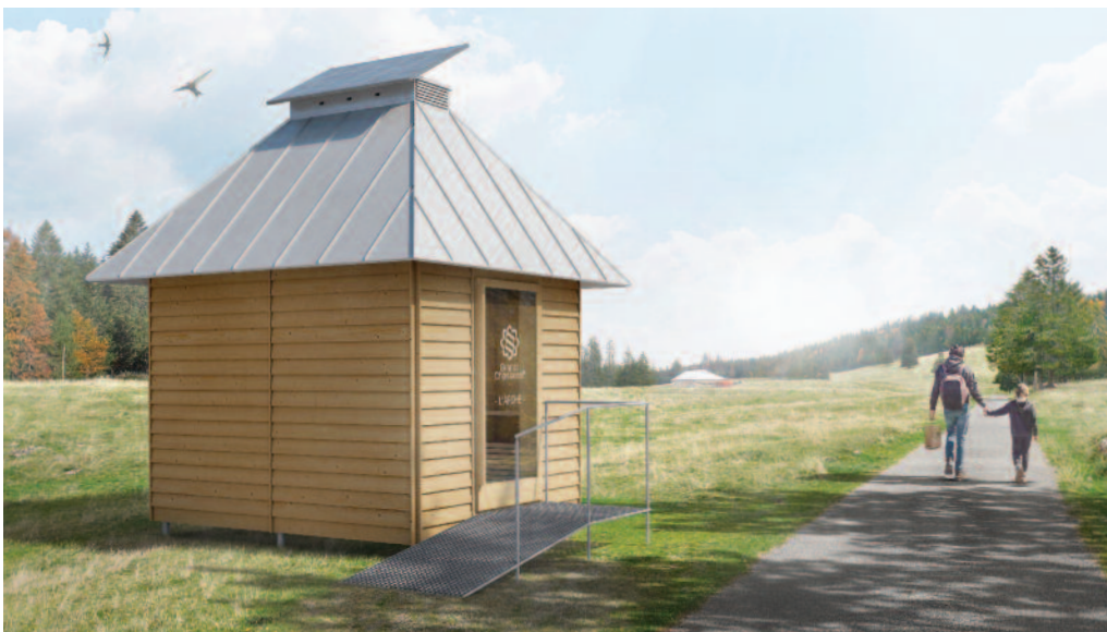
"Les Arches" projet du bureau ERBAT lauréat du concours

Lancé en 2023 par l'association du Projet de développement régional (PDR) du Jura bernois "Produire et manger local", le concours invitant à créer un cabanon "made in Grand Chasseral" a trouvé son vainqueur.