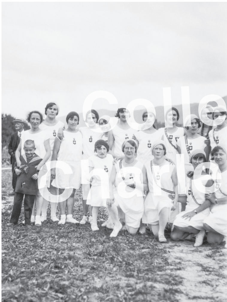
La Neuveville 1930, FSG Femmes.