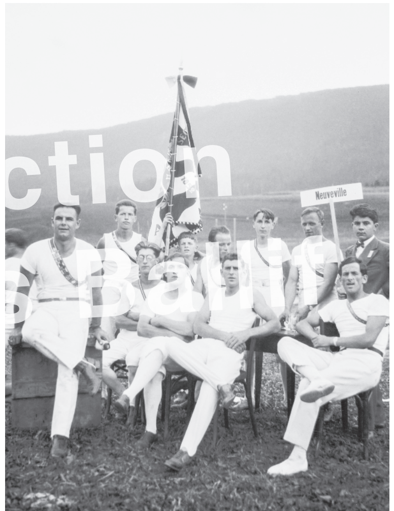
La Neuveville 1930, FSG Hommes.