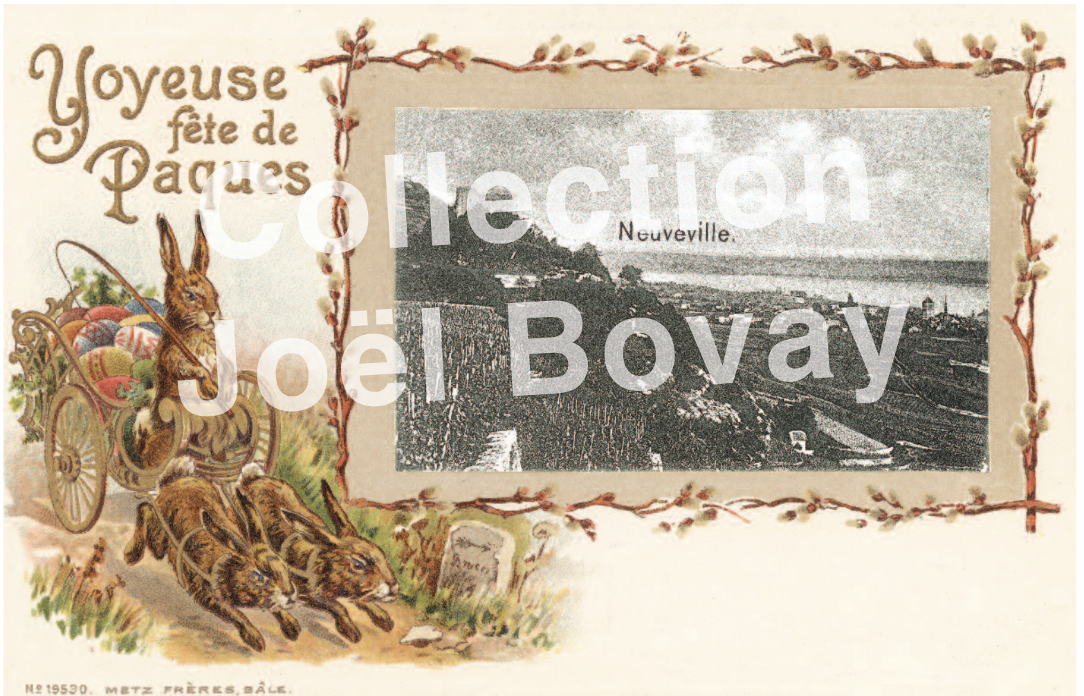
La Neuveville 1899.