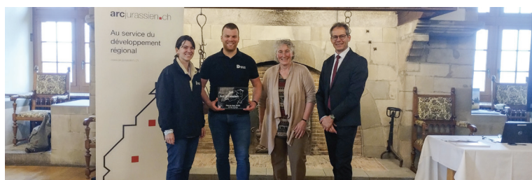
D/CLIC Terroirs, entreprise partenaire du Parc Chasseral, a reçu le prix du jury lors de la remise du Prix de l'Arc jurassien ce vendredi à Boudry.

Plusieurs entreprises collaborant avec le Parc Chasseral ont vu leur engagement et leur innovation récompensés ces derniers jours. D/CLIC Terroirs, l'une de nos Entreprises partenaires, a reçu le prix du jury lors de la remise du Prix de l'Arc jurassien ce vendredi. Elle était également nominée pour l'agroprix 2024. La fromagerie Spielhofer et Codec SA ont quant à elles reçu le premier, respectivement le deuxième Prix SVC Suisse romande 2024 en début de semaine.