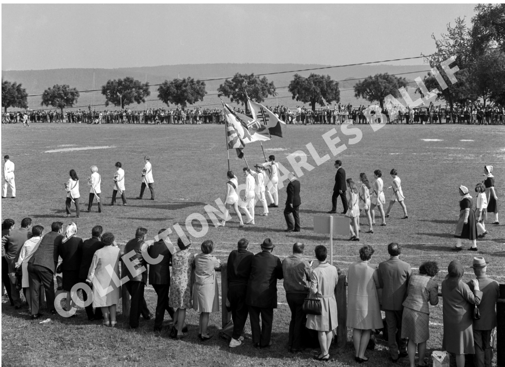
La Neuveville, 1969, Fête jurassienne

Découvrez notre nouveau site internet et retrouvez les anciennes éditions du Courrier et de la Feuille Officielle sur