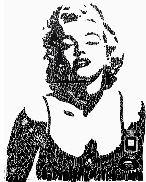
D'un portrait à l'autre, l'on découvre à chaque fois d'autres détails. (Photos: instagram @yvan.besomi)

Sous les lumières feutrées de la Galerie Fleurie, les regards s'attardent, curieux, intrigués. À première vue, ce sont des visages, des icônes que l'on croit reconnaître au premier coup d'œil. Mais en s'approchant, le regard se trouble et découvre un foisonnement de détails, de personnages miniatures, de symboles entremêlés. C'est tout l'art d'Yvan Besomi, qui, à travers son exposition «Trombinoscope», dévoile des portraits peuplés d'histoires. «J'aime l'idée que mes dessins soient des puzzles. Chaque détail compte, et pourtant, c'est l'ensemble qui fait sens.»