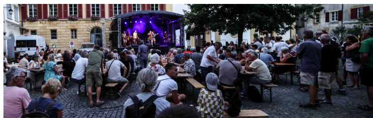
La Place de la Liberté était en fête pour la dernière soirée de la saison 2024 de la Zone Piétonne. (André Weber)

Cependant, la saison n'a pas été sans défis. L'annulation de dernière minute du concert de Hillbilly Moon Explosion, prévue le 18 mai, a laissé pantois un comité qui a décidé de changer de stratégie désormais, en n'annulant plus aucun concert, et ceci même si le ciel menace. Les prévi-