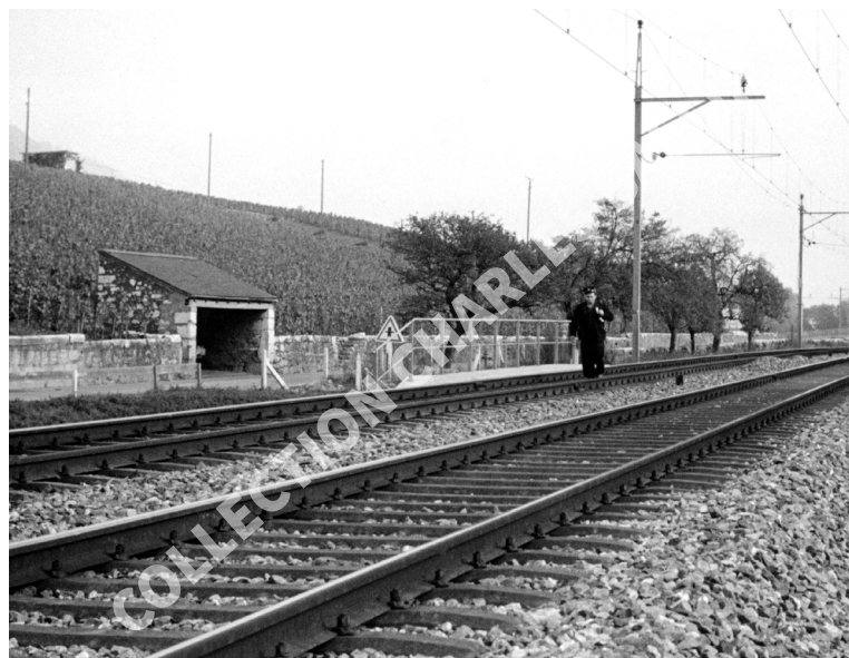
La Neuveville, 1975, Route de Bienne - Voies CFF