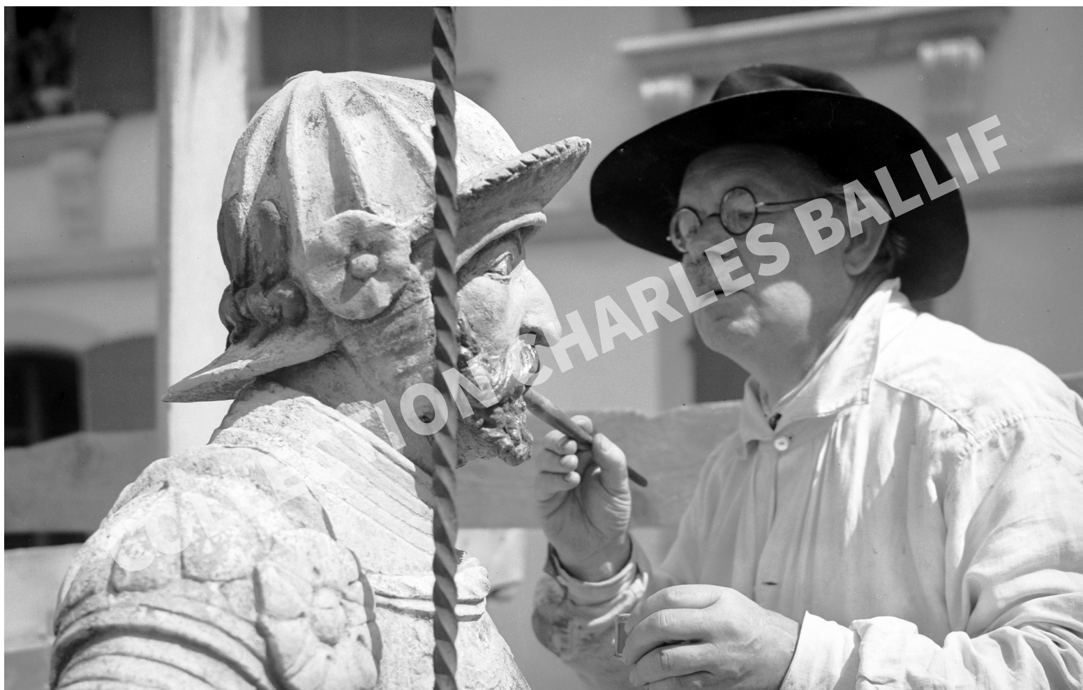
La Neuveville, 1936, Rue du Marché - Restauration de la fontaine - Ernst Geiger