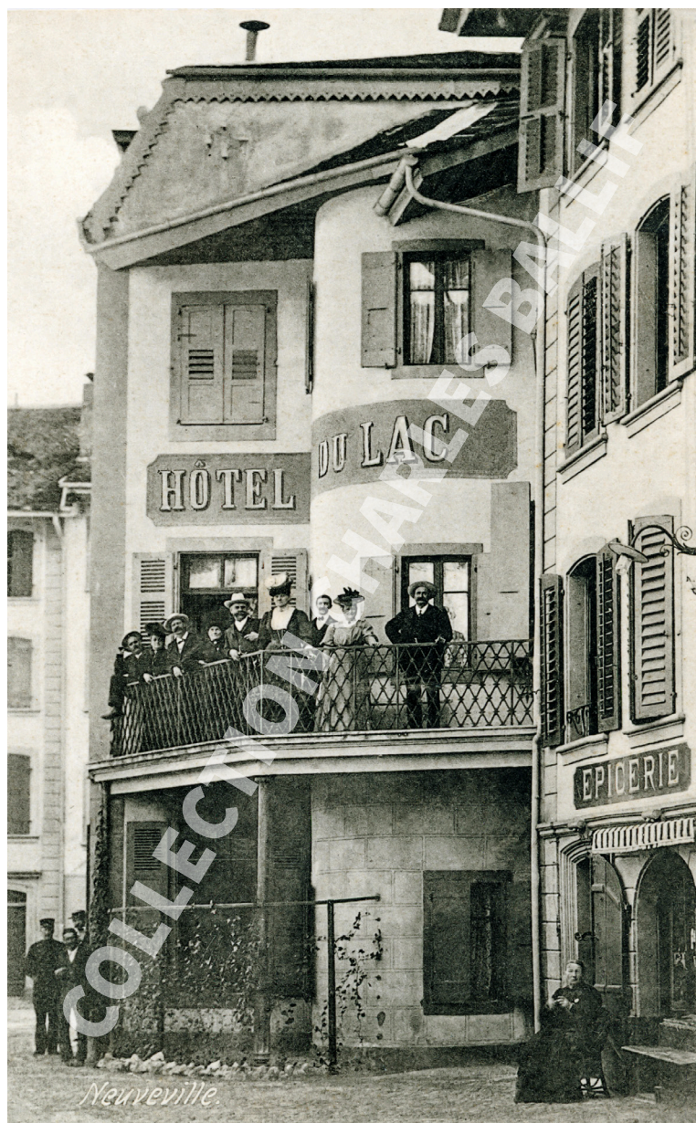
La Neuveville, 1907, Rue du Marché - Hôtel du Lac