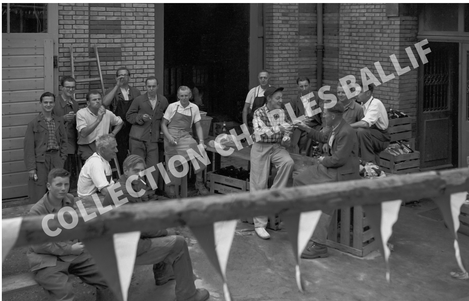
La Neuveville, 1949, Foire aux vins