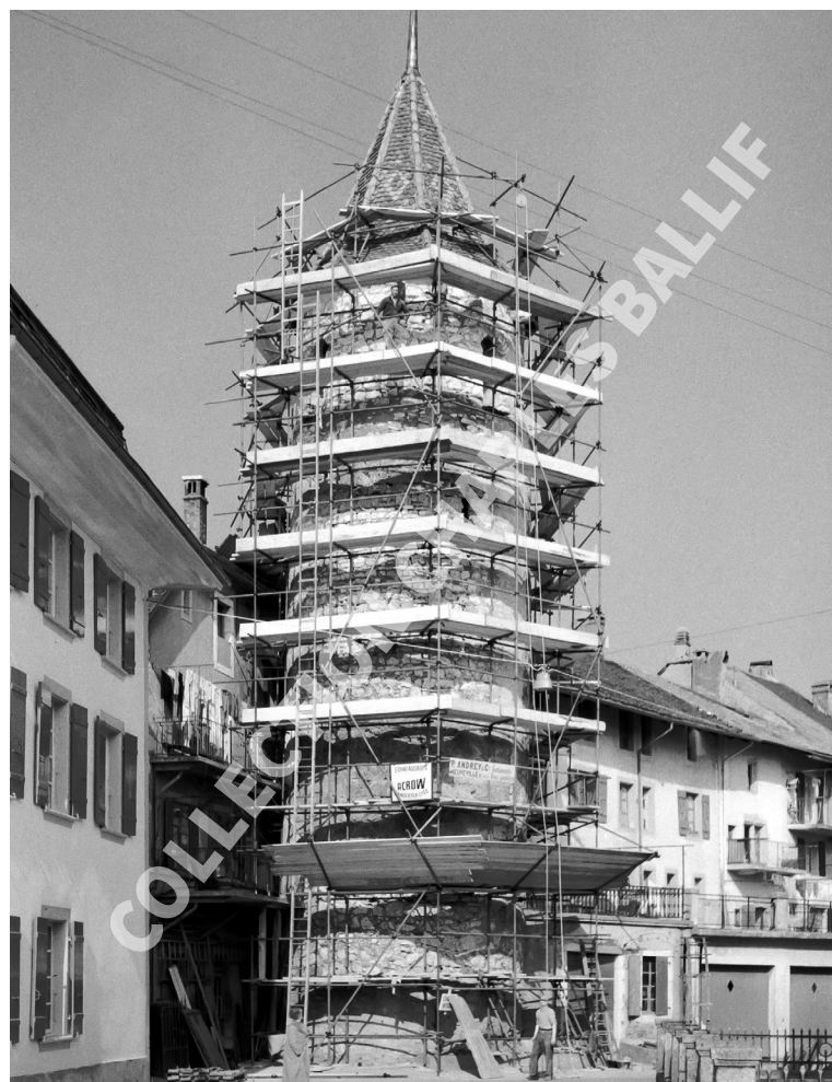
La Neuveville, 1958, Rue du Port - Tour Ballif