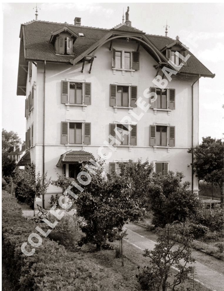
La Neuveville, 1929, Rue du Lac - Maison Gall