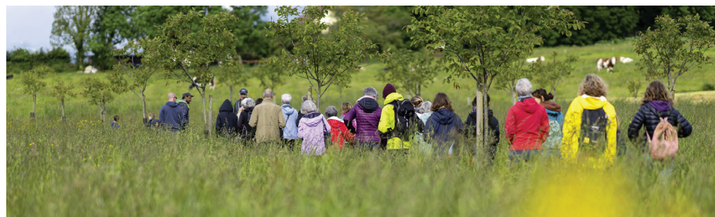
De prairies en étangs, la balade des jardins a réservé de belles surprises au public.