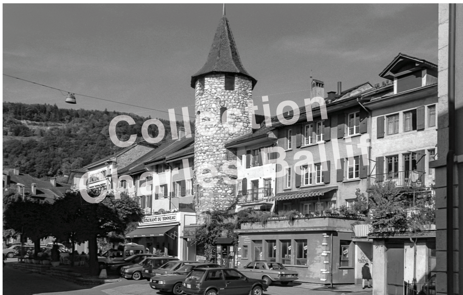
La Neuveville, 1993, Courtines Ouest - Tour Hildebrandt