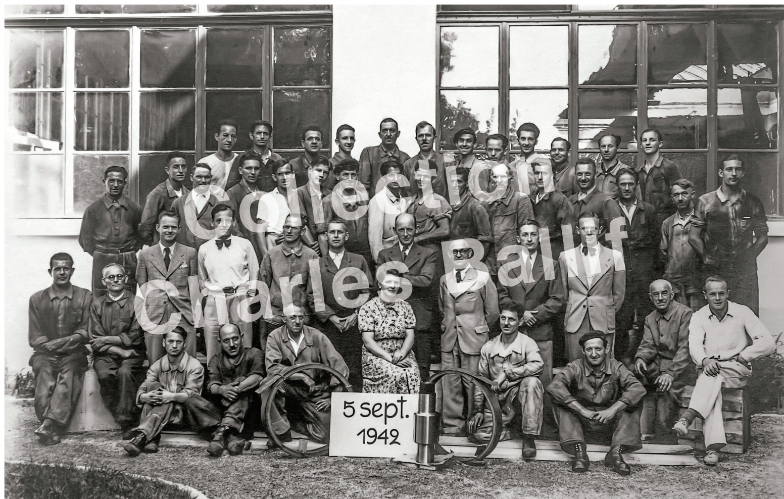
La Neuveville, 1942, Route de Neuchâtel, personnel de l'entreprise Matthey