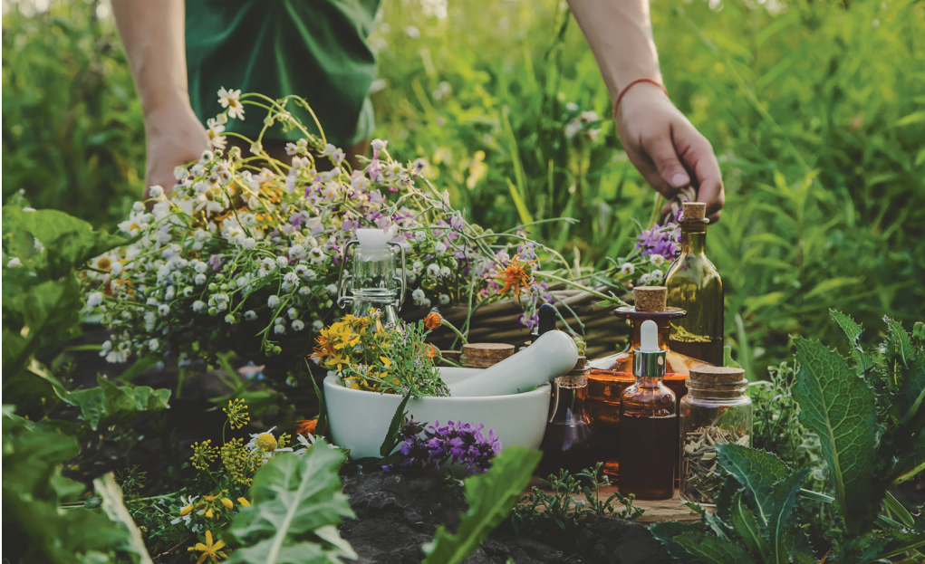
Au Parc Chasseral, la journée du 29 juin sera consacrée aux plantes médicinales et à leurs vertus.